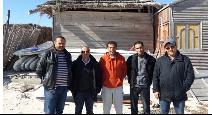
صورة لمستودع القوارب لجمعية جربة للرياضات البحرية