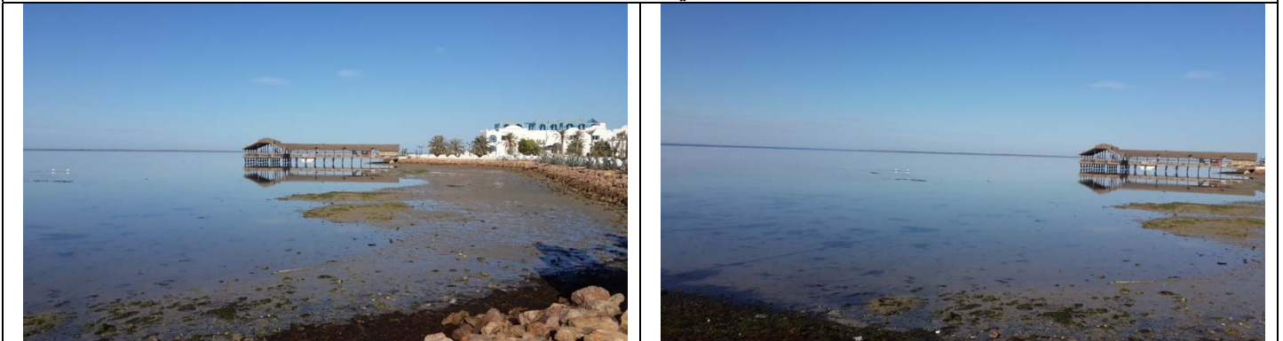
صورتان للمسطح المائي لنادي تيبازا الجرف أجيم جربة (عند الجزر)