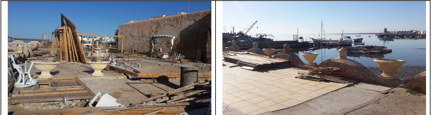
صوتان للأرض التي تحصلت عليها جمعية تيبازا