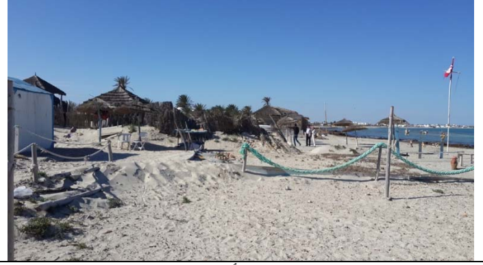
صورتين لشاطئ تافر ماس من أمام مستودع قوارب جمعية جربة للرياضات البحرية