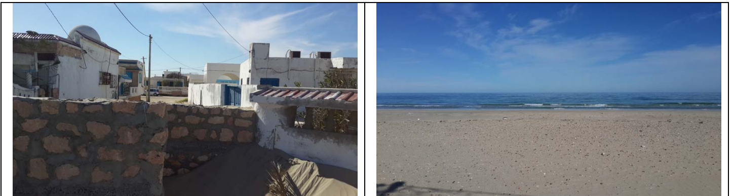
صورتان لشاطئ قابس ومستودع القوارب لجمعية قابس للرياضات البحرية